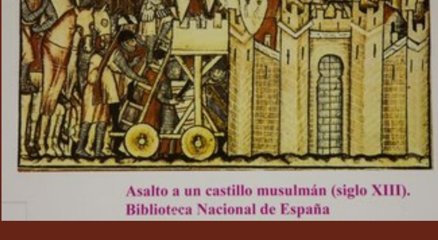
Asalto a un castillo musulmán (siglo XIII). Biblioteca Nacional de España

kindersterfte en werd het leven gewoon een stuk beter. Redenen genoeg voor hen om positief te zijn over de Islam.